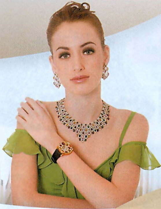
◀ 來自意大利的 Bertolucci，將其熱情的一面完全展露在這套彩色寶石首飾上。

◀ 具有年輕活力的珠形鑲飾，以黑鑽作主角，閃亮中帶着低調及神秘感，是時代女性的至愛。