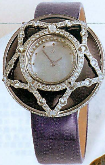
◀ 「Ouni Spilla」18K白金鑲鑽（278顆5.14卡），白色珍珠貝母表盤配紫色光漆面小牛皮表帶，屬訂製系列，定價$580,000。