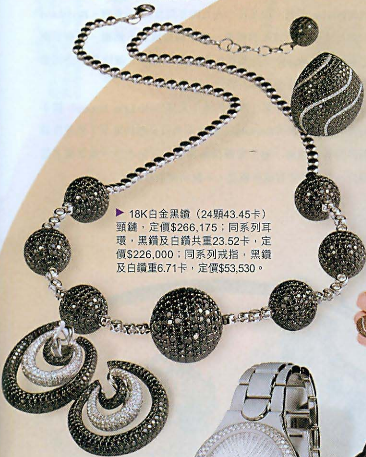
▶ 18K白金黑鑽（24顆43.45卡）頸鍊，定價$266,175；同系列耳環，黑鑽及白鑽共重23.52卡，定價$226,000；同系列戒指，黑鑽及白鑽重6.71卡，定價$53,530。

◀ 具有年輕活力的珠形鑲飾，以黑鑽作主角，閃亮中帶着低調及神秘感，是時代女性的至愛。